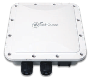
LAN2, LAN1(POE+), Reset-Taste