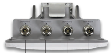
2,4 GHz Antenne 4, 5GHz Antenne 3, 2,4 GHz Antenne 2, 5GHz Antenne 1